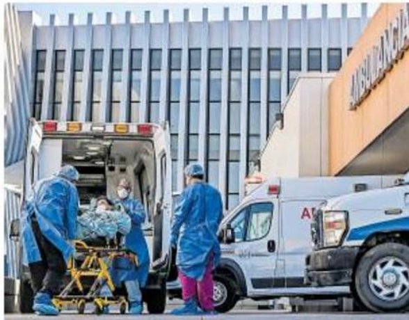
La pandemia ha dejado cinco mil 930 muertes y 35 mil 879 casos positivos

EN FEBRERO iniciaría la vacunación a adultos mayores de 60 años y se extendería de manera paulatina a la población durante este 2021